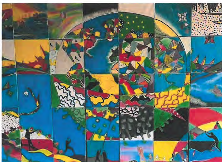
Het schilderij 'Het gevecht tegen corona' is gemaakt door leerlingen van NTC Het Kwadrant. Leerlingen kregen een vierkant met een in te kleuren ontwerp, zonder te weten aan welk groter geheel zij werkten.